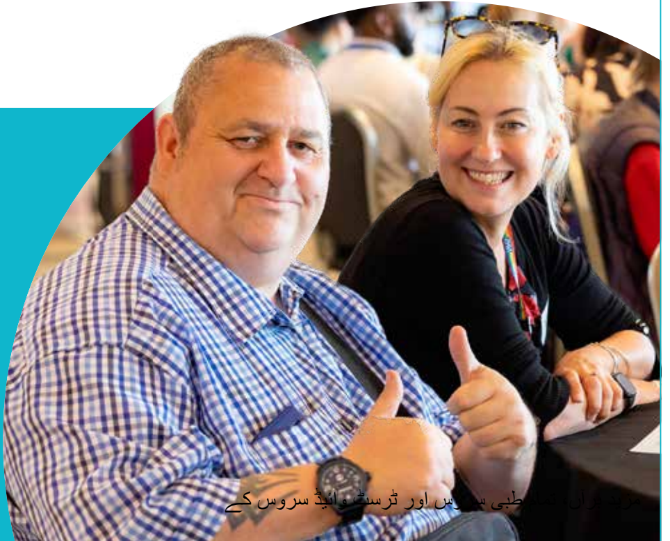
طبی سروس اور ٹرسٹ آئیڈی سروس کے

اگر آپ اس حکمت عملی کو پڑھ رہے ہیں اور اس سے پہلے پوچھا گیا یا اس میں شامل نہیں کیا گیا ہے، تو ابھی وقت نکالنے کا شکریہ۔ ہم آپ کے ساتھ ان پانچ سالوں میں کام کرنا چاہتے ہیں جن کی تفصیل اس عزائم کی دستاویز میں دی گئی ہے۔